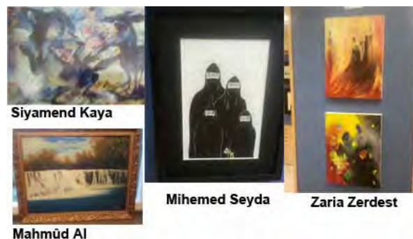
Ji pêşengeha resamên kurd çend nimûne 19.11.2011 Stockholm