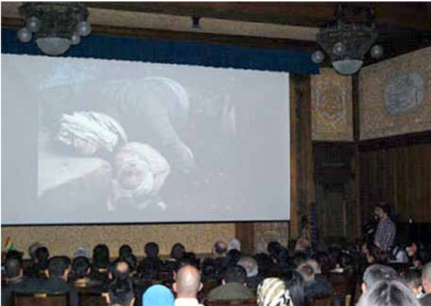
Bîranîna Helebçê li Upsalayê

Herweha di 16ê Adara 2012ê de Komeleya Kurd li Eskilstuna li meydana bajêr xwepêşandinekê ji bona Helepçeyê li dar xist. Di xwepêşandinê de posterên şehîdên Helepçeyê hatin vekirin, axaftin li ser karesata ku 24 sal berê li bajarê Helepçeyê ji aliyê Saddam Huseyn ê diktatorê Iraqê ku bi çekên kimyewî 5000 kurd jiyana xwe ji dest dan hatin kirin.