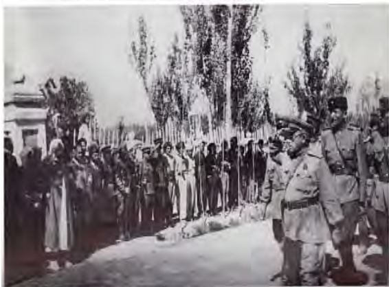
پپوره‌سمی ریژه‌ی پیشمه‌رگه‌ی هیزی ناوه‌ندی به فه‌رمانده‌یی سه‌رپۆلی 2 ئیبراهیمی سه‌لاح له به‌رامبه‌ر پیشه‌وا و فه‌دری به‌گ

ئهم وینیه‌یه‌ی ژهنه‌رال مایور مسته‌فا بارزانی فه‌رمانده‌ی هیزی بارزانیان و سه‌رلک (مایور) جه‌عفه‌ری که‌ریمی سه‌رۆکی ته‌واوی ستادی هیزی کوردستان له‌ بنگه‌ی وه‌زاره‌تی هیزی دیمۆکراتی کوردستان له‌ مه‌باد هه‌لگیراوه‌.