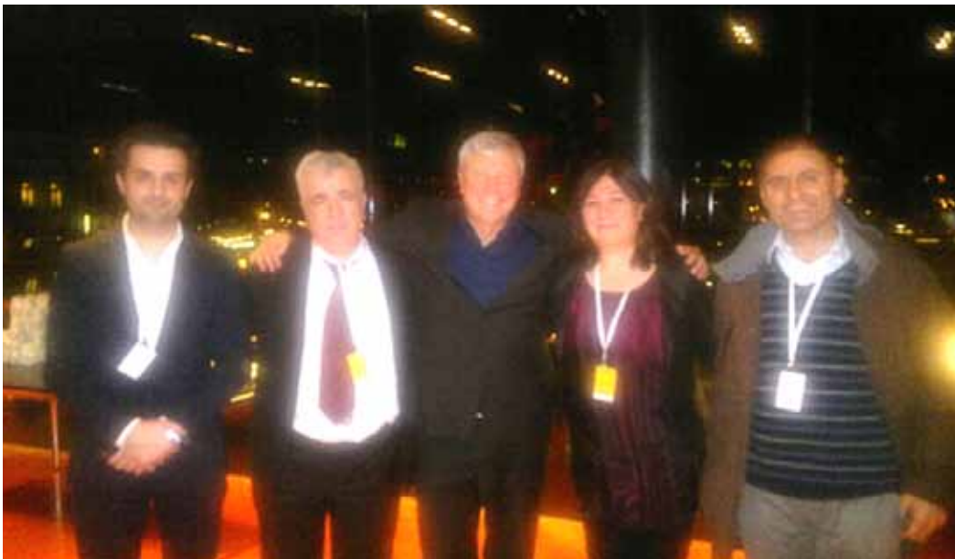
Şanda FKKSê sipasiya serokê berê yê Partiya Çep Lars Ohly kirin û diyariya Federasyonê taqdimê wî kirin.

Herweha şanda FKKSê serokê nû yê Partiya Çep Jonas Sjöstedt ku di kongreyê de hat hilbijartin pîroz kirin û bi hêviya hevkarî û tevkarîya wan dom bike, jê re serkeftin xwestin.