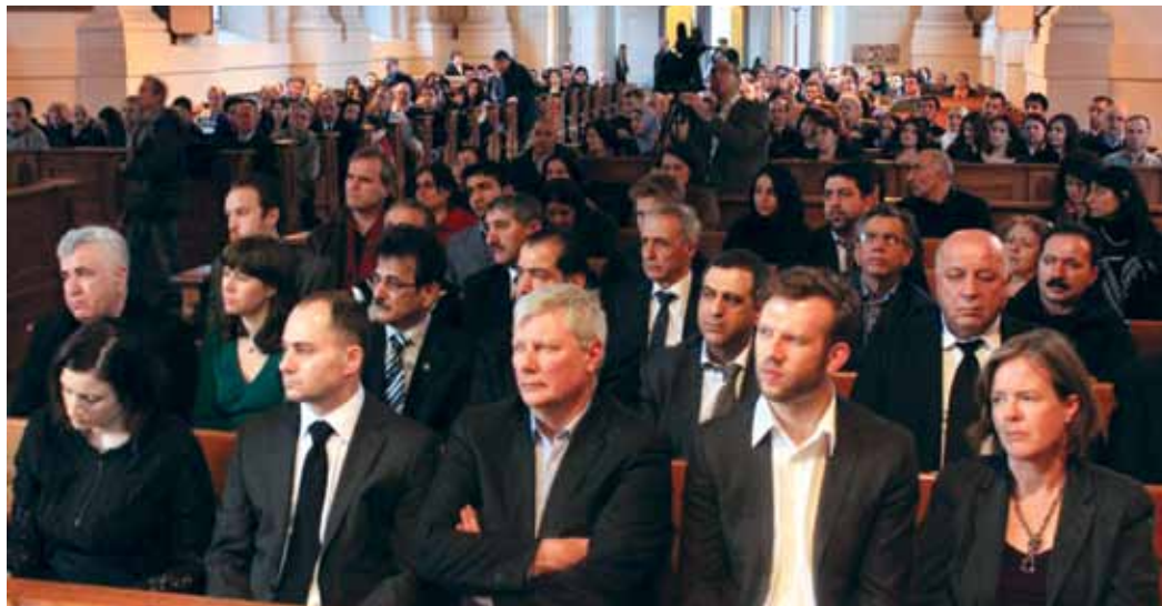
Federasyona Komeleyên Kurdistanê li Swêdê (FKKS) di 16ê Adarê 2012ê de li Stokholmê li Adolf Fredriks Kyrka şehîdên Helepçeyê bi bîranînê.

Grûba parlamenteran soz dan ku dê her sal li Parlamentoyê Swêdê bo şehîdên Halepçeyê bîranîn amade bikin.