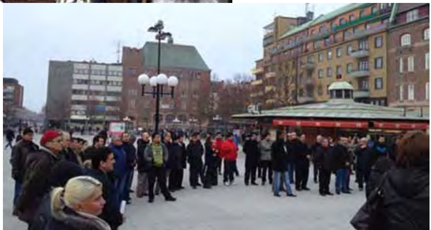
Bîranîna Helebçê li Eskilstunayê