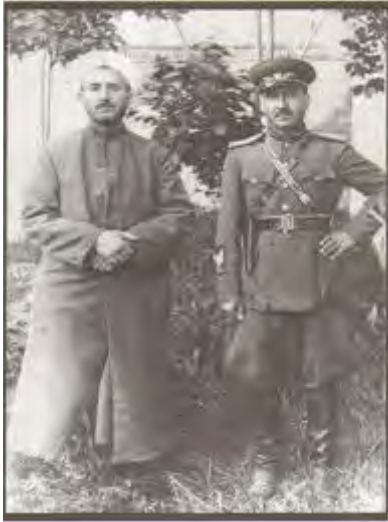
وینیهکی شهید پیشه‌وا و بارزانی نهمر چهند پوژیک دواي راگه‌یانندی کومار