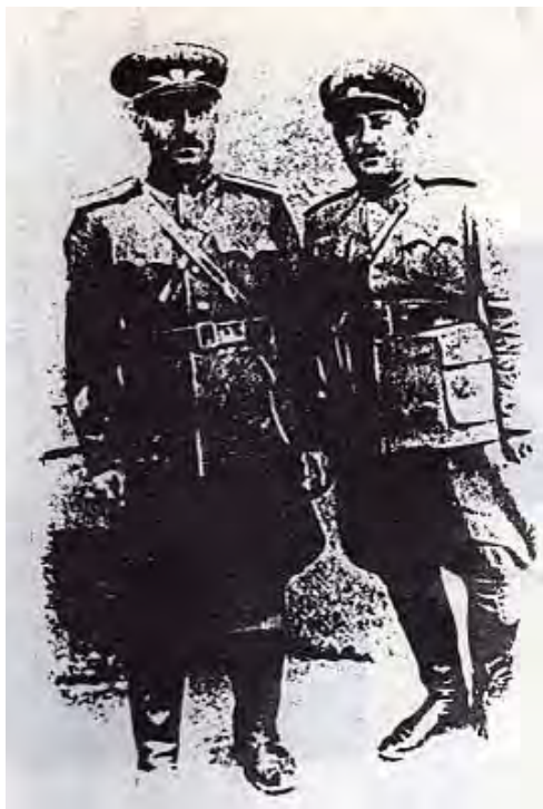
کوردستان ژماره‌ی 30، دووشه‌مۆ 12 ی خاکه‌لیوه‌ی 1325 ی هه‌تاوی / 1 ی ئاوریلی 1946

ئهم وینیه‌یه‌ی ژهنه‌رال مایور مسته‌فا بارزانی فه‌رمانده‌ی هیزی بارزانیان و سه‌رلک (مایور) جه‌عفه‌ری که‌ریمی سه‌رۆکی ته‌واوی ستادی هیزی کوردستان له‌ بنگه‌ی وه‌زاره‌تی هیزی دیمۆکراتی کوردستان له‌ مه‌باد هه‌لگیراوه‌.